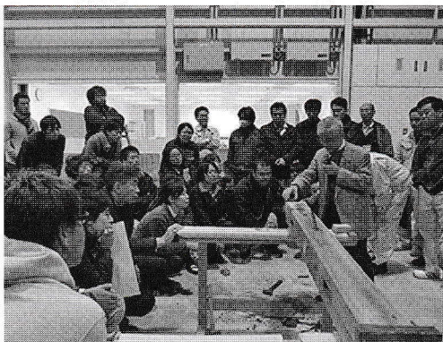
写真2 修復専攻科の研修風景