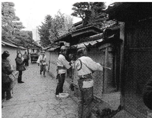
写真3 土塀の薦掛け風景(長町武家屋敷跡)

また、研修の一環として、本科研修生全員に必修の教養講座を行っている。内容は座学中心で、金沢の歴史的建築物の改修と活用、卓越した職人によるお話と実技などを行っている。